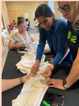
Taller de Bordado